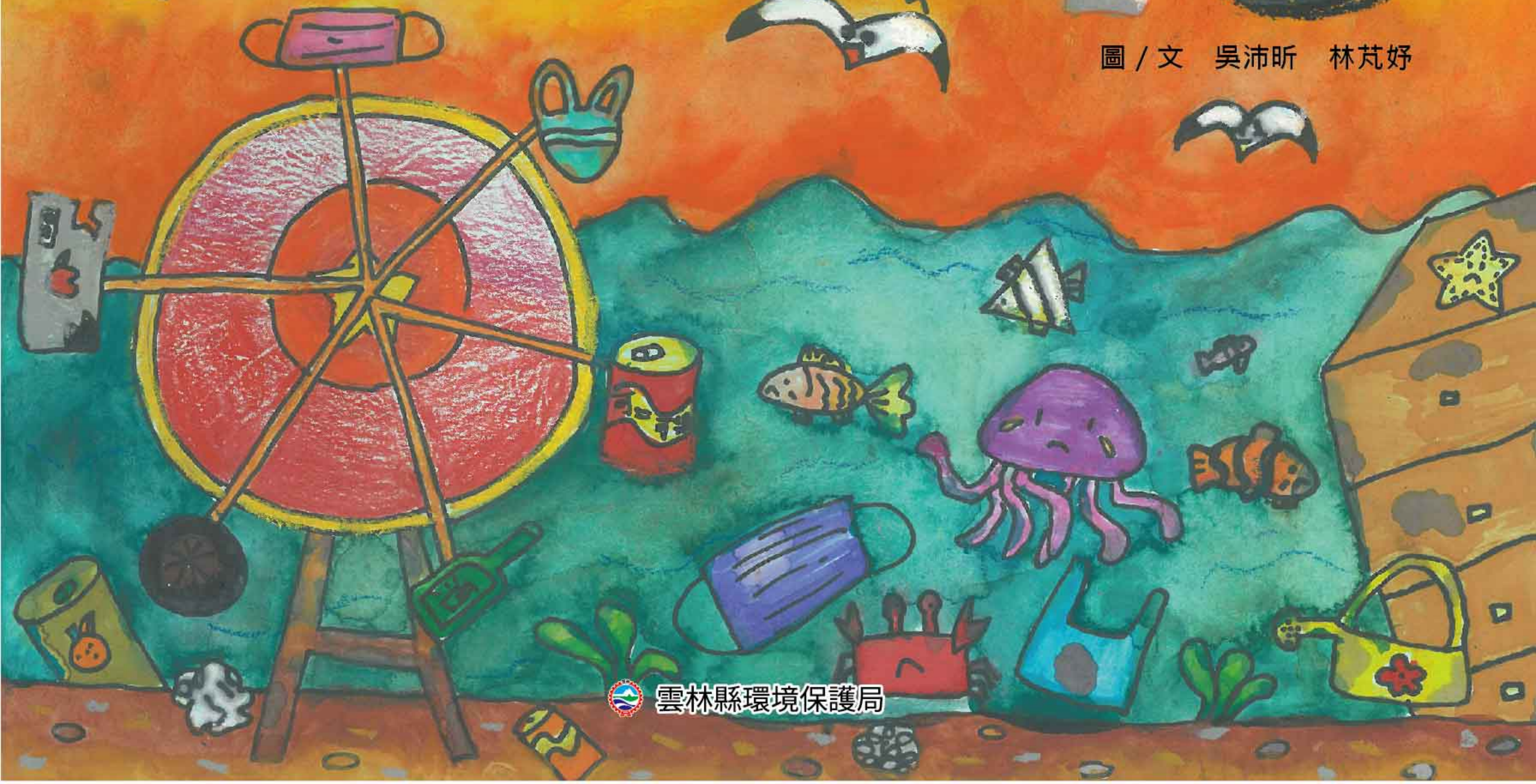
圖 / 文 吳沛昕 林芃妤